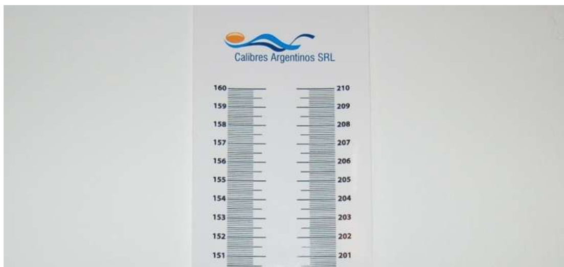
DETALLE DE LA PARTE SUPERIOR DEL TALLÍMETRO AUTOADHESIVO

EL TALLÍMETRO AUTOADHESIVO CALSIZE ESTÁ CONFECCIONADO EN MATERIAL VINÍLICO QUE NO SE DEFORMA. DEBE SACAR EL PAPEL PROTECTOR DE LA ZONA POSTERIOR Y PEGARLO A UNA SUPERFICIE PLANA (Pared de cemento, madera, puerta), CORROBORANDO QUE SE ENCUENTRE A PLOMO Y A 50cm DEL PISO, QUE SE TOMA COMO LA REFERENCIA O INICIO DE LA MEDICIÓN.