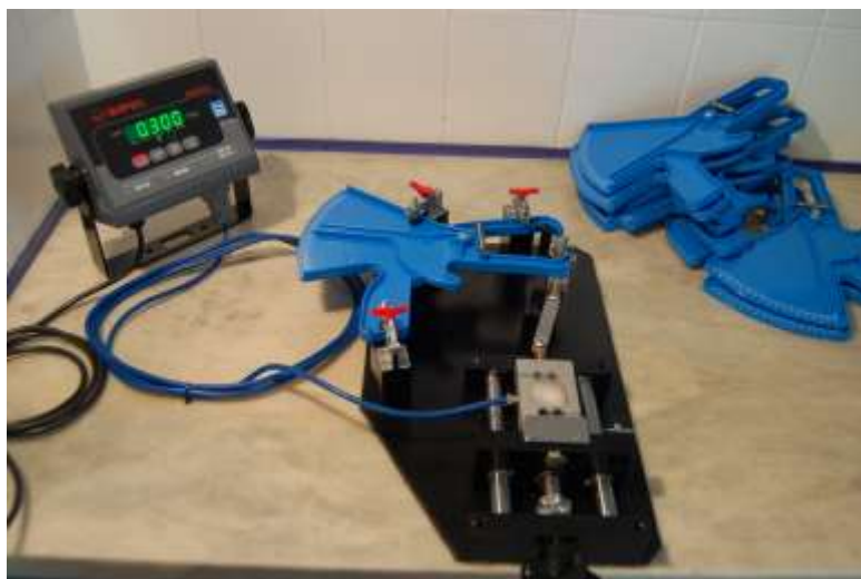
CALIBRACIÓN EN CELDA ELECTRÓNICA DE CARGA