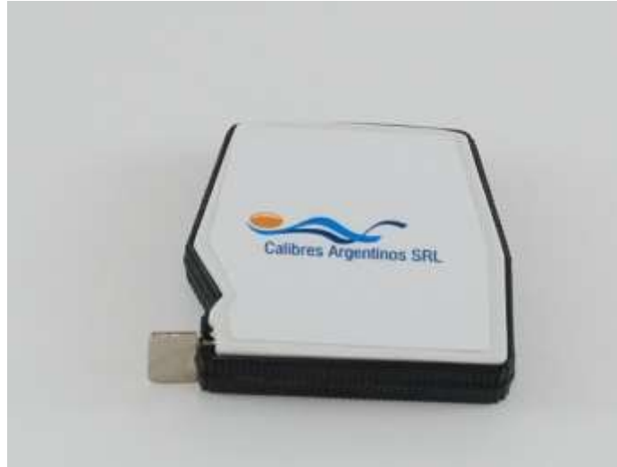
CINTA ANTROPOMÉTRICA METÁLICA CALIBRES ARGENTINOS