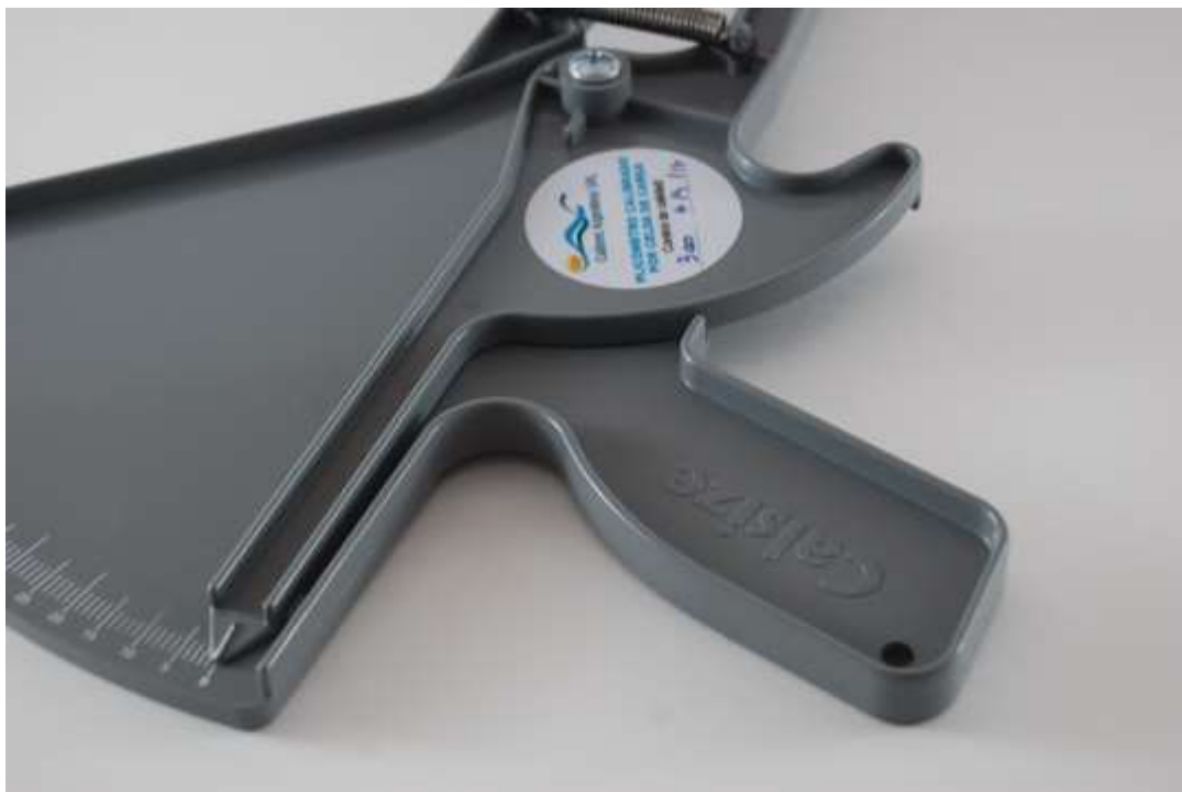
DETALLE DE LA ESCALA DEL PLICÓMETRO CALSIZE