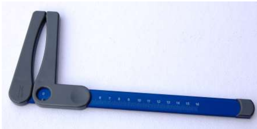
CALIBRE DE DIÁMETROS ÓSEOS PEQUEÑO CALIBRES ARGENTINOS

El calibre de diámetros óseos pequeño es una herramienta de uso específico para la medición de los diámetros del húmero, fémur, biestriolideo, bimalleolar, ancho de mano y pie. Por la localización y el tamaño de estas variables antropométricas, se hace indispensable contar con esta herramienta de pequeño tamaño y fácil manipulación.