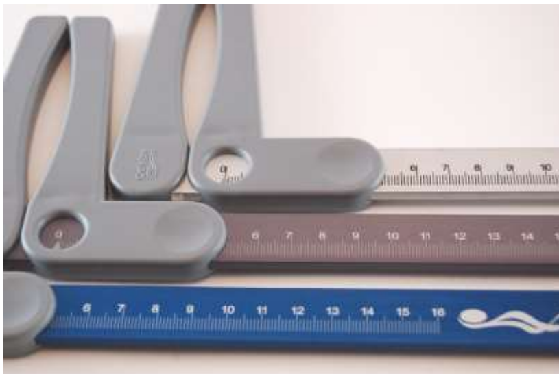
DETALLE DE LA VENTANA DE LECTURA Y COLORES DE LA REGLA DE ALUMINIO

Puede solicitar el calibre pequeño en tres colores diferentes de aluminio: